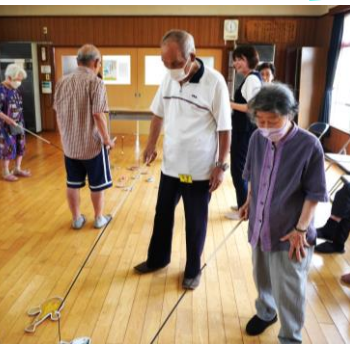
▲釣りっこ体験のようす