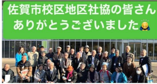
佐賀市校区地区社協の皆さん ありがとうございました

令和7年1月10日に計27名の方々が来県され、地域での集いの場づくりの活動や多世代交流の活動などについて意見交換を行いました。大分市からも、地域での集いの場や多世代交流の活動を活発に行っている、春日校区社会福祉協議会とボランティア金池の活動者の方にご参加いただき、活発な意見交換を実施しました。