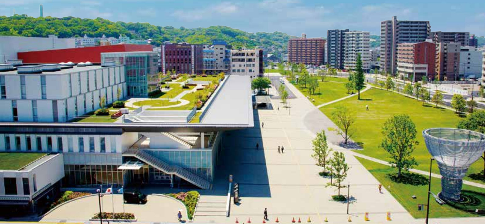
J:COM ホルトホール大分と大分いこの道