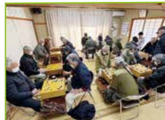
白熱する「囲碁大会」