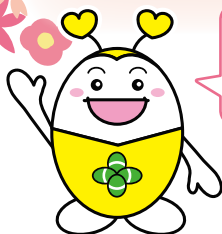
大分市社協マスコットキャラクター 福祉のピロロちゃん

タイトルの「ぶんぶく」は大分市社会福祉協議会からの「分福」と「福を分ける」という意味を込めています。