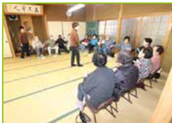
「出張サロン」での健康体操