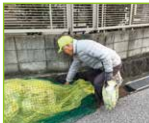
「お困りごとボランティア」でのごみ出し