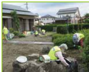
「きりんの会」での草むしり

また、高齢者サロンが立ち上がっていない地域での「出張サロン」や校区全体のイベントとして毎年「グラウンドゴルフ大会」を開催するなど、住民と一体になって坂ノ市校区内のふれあいの場・集いの場の支援を行っています。